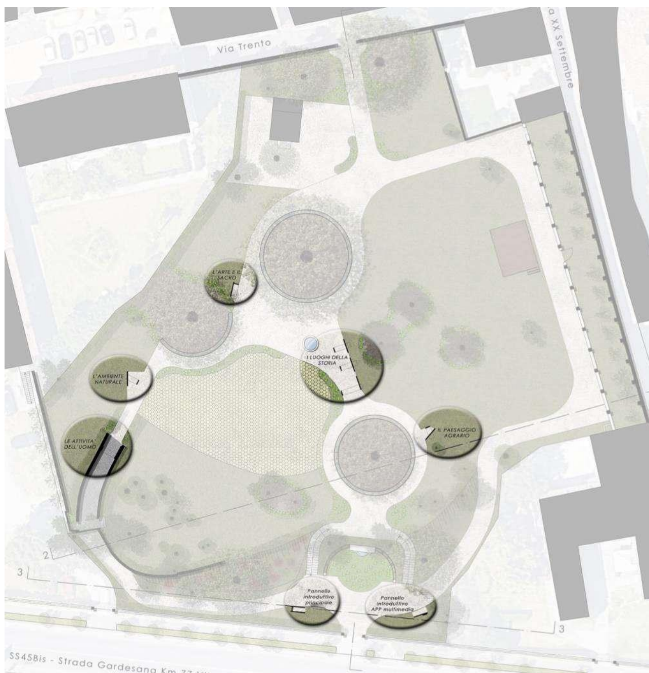
ESTRATTO TAVOLA PROGETTUALE – INDIVIDUAZIONE PANNELLI ESPOSITIVI

Quale parte integrante dell'intero progetto di riqualificazione del Parco Bernini risulta la creazione di un'esposizione fisica fissa che possa identificare il parco quale punto-visita dell'ecomuseo di Toscolano Maderno. Le tematiche dell'ecomuseo sono state organizzate secondo cinque tematiche principali pertanto le installazioni presenti saranno cinque più i due pannelli introduttivi presenti all'ingresso Sud del Parco. Come richiesto in sede di Autorizzazione ai sensi dell'art. 21, comma 4 del D. Lgs 22 gennaio 2004, n. 42 i due pannelli in corrispondenza dell'ingresso sono stati allontanati tra loro e disallineati al fine di evitare ogni possibile occlusione percettiva dell'esedra.