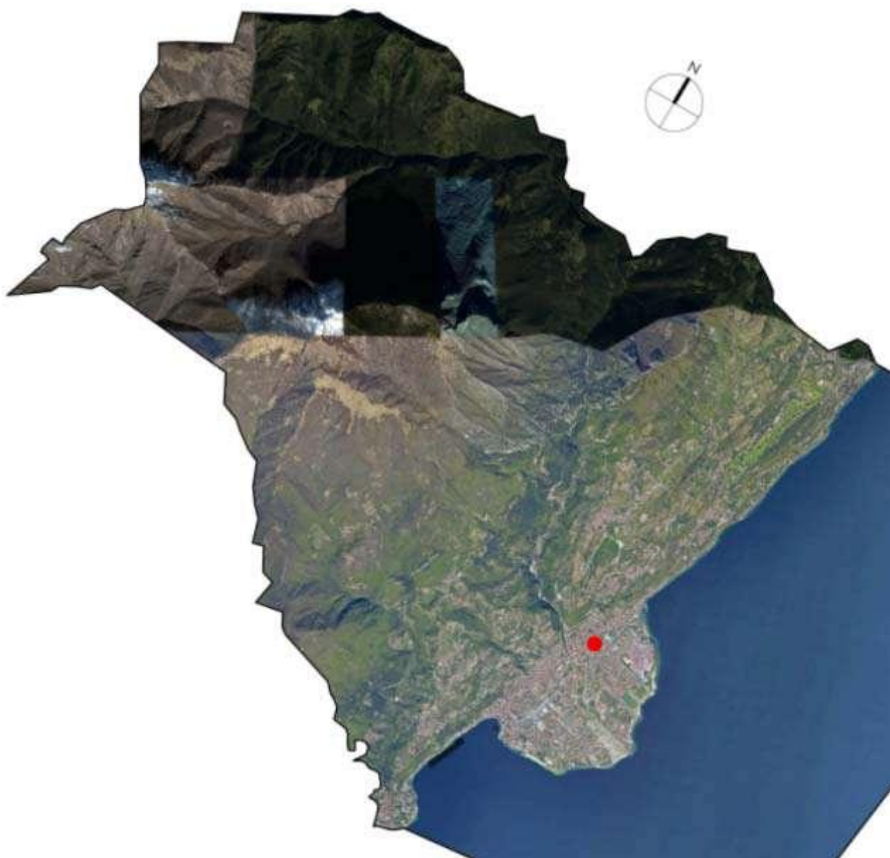
Ortofoto generale del territorio del Comune di Toscolano Maderno con indicazione Parco Bernini