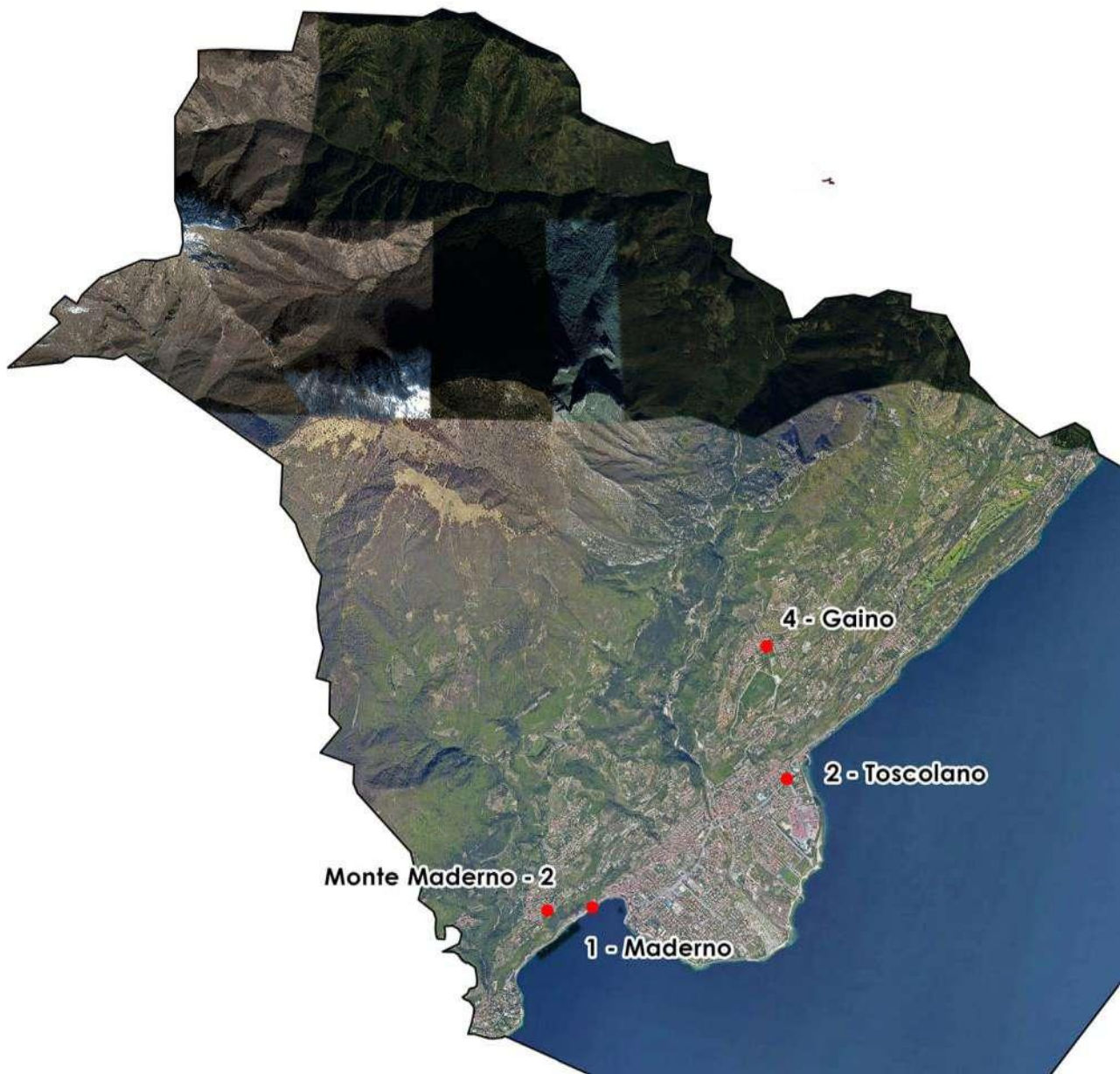
Ortofoto generale del territorio del Comune indicazione totem principali (eccetto valle delle cartiere)

Oltre all'interno del Parco Bernini l'allestimento espositivo si espande su tutto il territorio comunale coinvolgendo sia le frazioni principali che altri luoghi di elevato interesse quali la valle delle cartiere. Di seguito si riporta la mappa con indicata la posizione dei totem principali esterni al confine del parco.