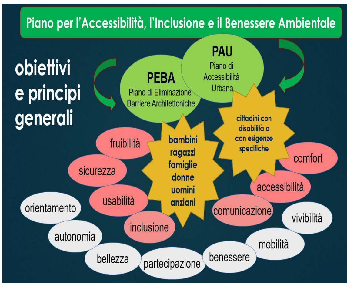
Fig. 1 – Obiettivi e principi