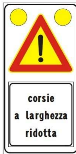
Figura II 391c Art. 31