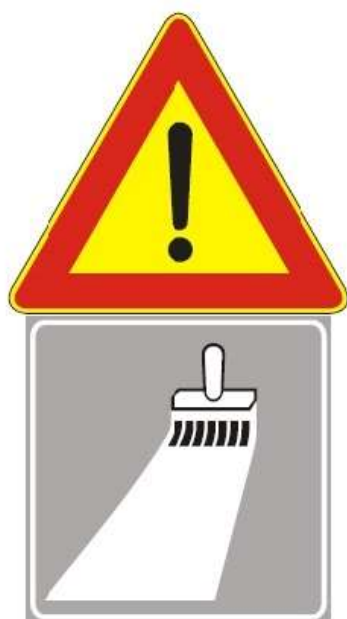
Figura II 391 Art. 31