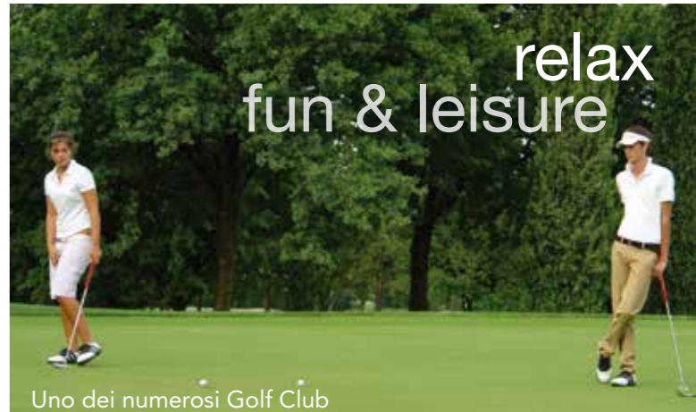
Uno dei numerosi Golf Club

Immagine copertina: Roberto Covre Rokox Studio Foto credits: Merighi, Fotostudio Image, Virgilio Gilberfi, Foto Brescia in vetrina, Archivio Provincia di Brescia Turismo, Archivio Riserva Regionale Valle Camonica | Formatgrafico, Eliana Valenti